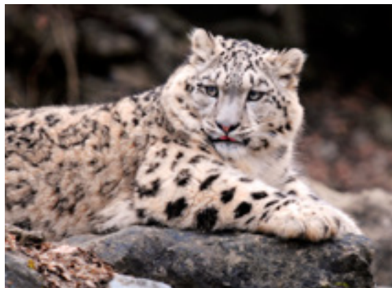
Снежный барс

Правительство РФ утвердило разработанную Минприроды России «Стратегию сохранения редких и находящихся под угрозой исчезновения видов животных, растений и грибов в Российской Федерации на период до 2030 г.». Документ размещен на официальном сайте Правительства Российской Федерации.