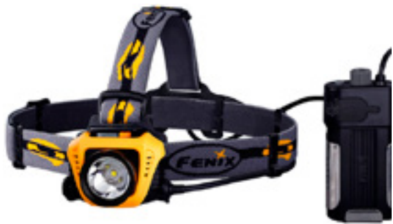
Fenix HP30 / fenixlighting.com

Несколько моделей налобных фонарей предложила охотникам компания Fenix. Среди них – модель HP05. В этом фонаре