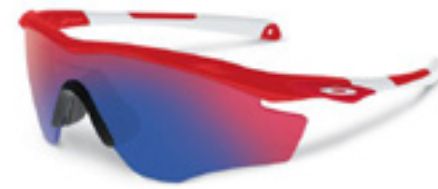
Oakley M2 Frame

Подробнее о новинке – на сайте gearshout.net