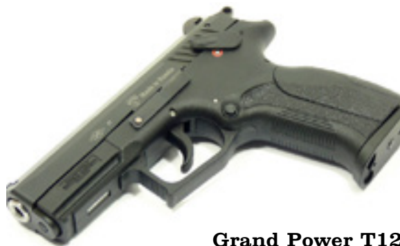
Grand Power T12

В оружейный магазин поступили на продажу пистолеты Grand Power T12. Пистолет имеет следующие технические характеристики: калибр — 10x28, масса (без патронов) — 770 г, габариты (ДхВхШ) — 187.5x133x36 мм. Зарезервировать пистолет Grand Power T12 можно по тел. 8(48439)9-24-01.