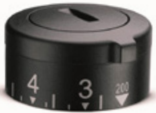
Баллистическая турель SWAROVSKI OPTIK

Охотник может в любой момент переключаться с индивидуального баллистического регулятора на стандартную систему, в которой используются кольца, и обратно без повторной пристрелки оружия. Анодированное покрытие защищает РВС от внешних повреждений и коррозии. Имеется также специальный выступ для проверки дистанции пристрелки, который обеспечивает безопасность использования и удобство захвата – даже с надетыми перчатками и в условиях сумерек.