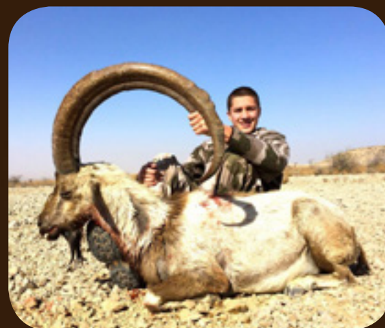
Охота в Пакистане