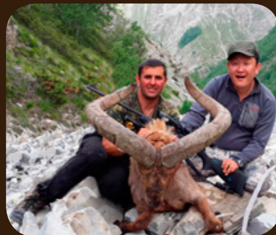
Охота в Азербайджане