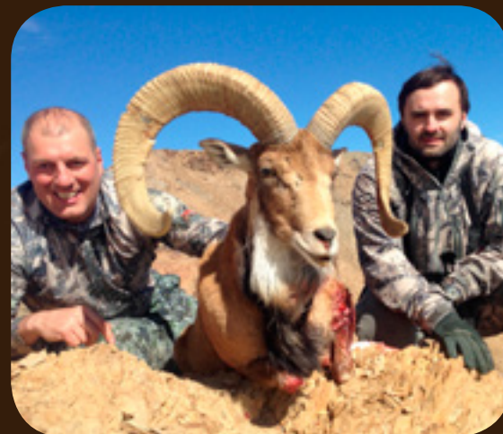
Охота в Иране

AZERBAIJAN PROFESSIONAL HUNTING OUTFITTER