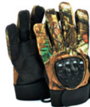
T&M Tactical Hunting Light Gloves

Новинка выполнена из камуфляжной ткани (расцветка Mossy Oak Break-Up Infinity), так что она будет прекрасно сочетаться с комплектами одежды от разных производителей.