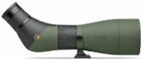
MeoPro HD 80

Новинка MeoPro HD 80 разработана на основе самых современных технологий. Несмотря на то что она позиционируется в своем классе как «бюджетный вариант», новинка имеет характеристики, практически идентичные своей «старшей