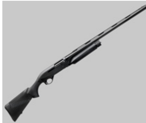
BENELLI M2 20 LH

различной толщины позволяет подогнать длину приклада к индивидуальным антропометрическим особенностям стрелка, причем сделать это можно даже во время охоты.