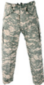
Брюки Gen II ECWCS

Интернет-магазин предложил покупателям мужские мембранные брюки ECWCS Gen II (производитель Helikon-Tech). Они изготовлены из Helikon-Tech® Comfort H 2 O Proof тканей. Особенность этих материалов в том, что они позволяют дышать телу, не создают «парникового эффекта», но при этом являются полностью водо- и ветроза-