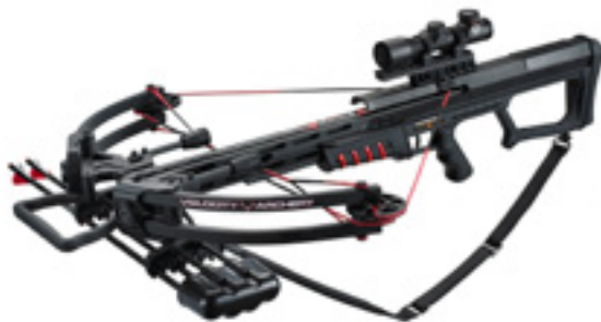
Арбалет блочный МК-400

Самарский магазин получил партию блочных арбалетов. В наличии есть модели МК-400, МК-380 и МК-350.