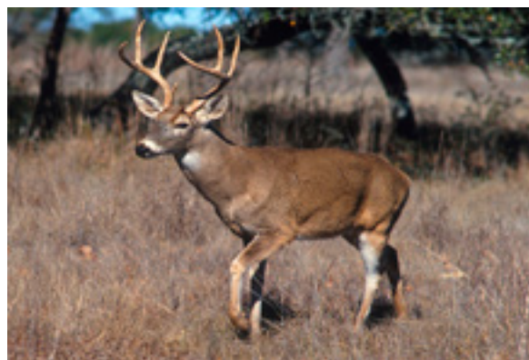
Белохвостый олень

244 белохвостых оленя завезены в одно из хозяйств Бобровского района. Они доставлены туда из штата Огайо (США). Отметим, что разводить белохвостых оленей в Воронежской области начали совсем недавно: первая партия была завезена в Подгоренский район в нынешнем году.