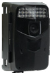
Razor 8 / wildgameinnovations.com

Компания Wildgame Innovations (США), специализирующаяся на производстве охотничьих аксессуаров, постоянно радуется охотников качественными товарами по очень разумной цене. В 2013 г. она представила новую серию компактных манков FlexTone Torch Series E-Calls и широкую линейку бюджетных лазерных дальномеров Halo Xtanium, отличающихся современным дизайном и неплохими техническими характеристиками при низкой цене. Новинка-2014 – окрашенная в камуфляжные цвета и имеющая дизайн в стиле фильма «Звездные войны» компактная камера Razor. Она стоит недорого, но по своим характеристикам вполне сопоставима с более дорогими моделями от ведущих мировых производителей. Razor имеет фиксированное приближение 8X и 6X, комплектуется автоматической вспышкой и технологиями записи фото и