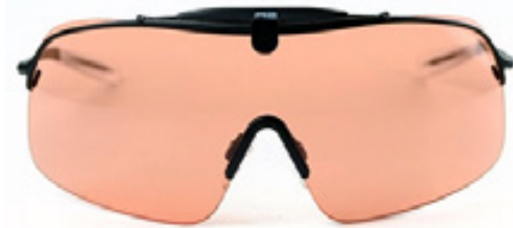
RE Ranger Falcon Pro / ammoland.com

Американская компания начала продажи дорогих, стильных и удобных очков для стрельбы, прототип которых был показан в январе на выставке Shot Show.