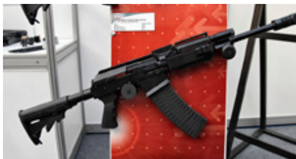
Вепрь-12 Молот

В оружейном салоне (Одинцово) появился в продаже «Вепрь-12 Молот» в разных исполнениях (00, 01, 02, 03, 04). Гладкоствольный самозарядный карабин «Вепрь-12 Молот», разработанный на основе конструкции ручного пулемета Калашникова, предназначен для охоты, спортивных соревнований (как правило, по практической стрельбе в открытом классе), самообороны, а также использования в качестве служебного оружия.