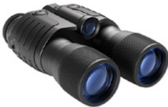
BUSHNELL 2.5x 40mm Lynx / bushnell.com

Американская компания Bushnell, которая на протяжении 65 лет является одним из