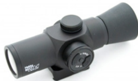
НАККО Н-1

Установка прицела возможна на планки Weaver или Picatinny (в корпус прицела интегрировано крепление).