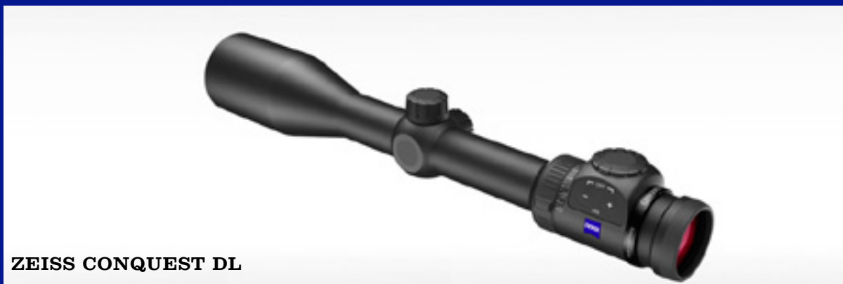
ZEISS CONQUEST DL

Производятся прицелы новой линейки будут исключительно в Германии.