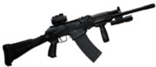
Сайга-12К 030

16 июля Министерство финансов США объявило, что Вашингтон вводит дополнительные санкции против России. В санкционный список вошел, в частности, оружейный концерн «Калашников». После объявления новых санкций американцы начали активнее, чем прежде, скупать автоматы Калашникова, опасаясь, что они станут дефицитными.