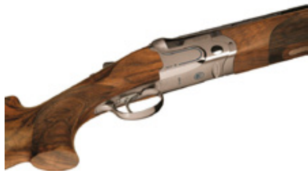
Beretta DT 11

Московский оружейный магазин «Барс» сообщил о пополнении ассортимента гладкоствольного и нарезного оружия и патронов импортного производства.