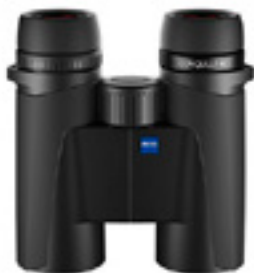
Carl Zeiss Conquest HD

Напомним, что бинокли серии Conquest HD имеют неизменно высокое качество ZEISS, обновленный дизайн с сохранением высоких эксплуатационных характеристик и оптическую систему линз, изготовленных из стекол с очень малой дисперсией.