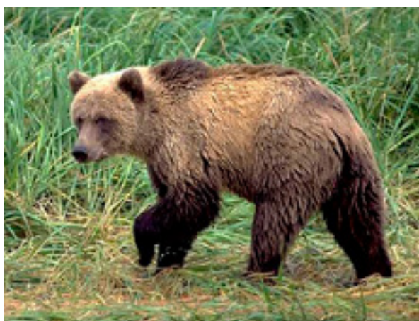
Бурый медведь

Охота на лося на реву будет разрешена с 1 сентября.