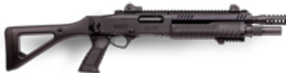
STF 12 Compact

Итальянская компания представила ружье Fabarm STF12. Оно имеет хромированные стволы 76 мм, стальные антабки, сменные затыльники, фиксированный или складной