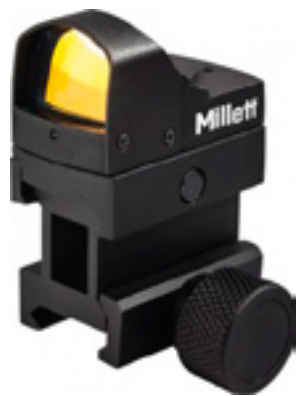
Millett M-Pulse

Компания Millett (США) проанонсировала сразу три новинки - тактические оптические и коллиматорные прицелы в серии RedDot.