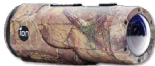
iON CamoCam / ioncamera.com