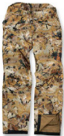
Beretta Xtreme Ducker Light

Итальянская компания представила новую коллекцию охотничьей одежды, рассчитанную на искушенных покупателей.