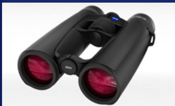
ZEISS VICTORY® SF / zeiss.com

Компания Carl Zeiss представила модель VICTORY SF. Это - один из самых совер-