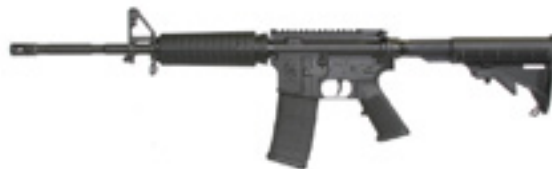
Defensive Sporting Rifle™ 15F / armalite.com

продаже присутствуют три модификации. Винтовки Defensive Sporting Rifle 15 и Defensive Sporting Rifle 15F имеют калибр 5,56x45 мм NATO и комплектуются 16-дюймовым стволом из хром-молибден-ванадиевого сплава MIL-B 11595 E. Модификация Defensive Sporting Rifle 10 имеет калибр 7,62x51 мм NATO и 16-дюймовый ствол из сплава стали и редкого минерала мелонита, который обеспечивает непревзойденные характеристики по теплоустойчивости и прочности. Верхний и нижний ресиверы выполнены из алюминия марки 7075-T6. Винтовки имеют предустановленные тактические планки армейского стандарта MIL-STD 1913 для установки оптического прицела. По словам вице-президента компании ArmaLite Уолта Хассера, новинки должны представить легендарную надежность винтовок AR по доступной для широкого покупателя цене и привлечь новых