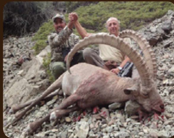
Охота в Казахстане