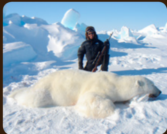
Охота в Канаде