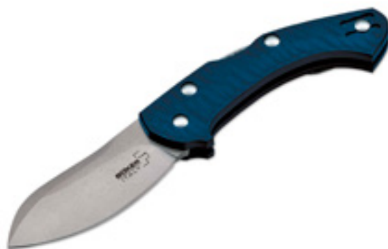
Boker Plus Zero Blue

Торговые марки Boker Plus и Magnum by Boker, являющиеся частью компании Boker (Германия), пополнились новыми моделями карманных ножей. В их числе складные ножи Boker Plus Zero Blue и Magnum Alpha Kilo.