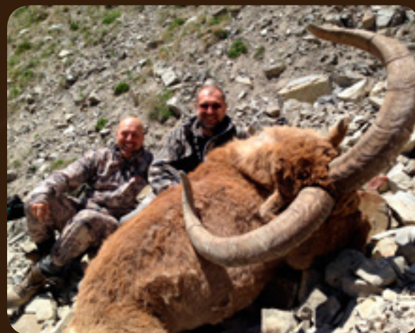
Охота в Азербайджане