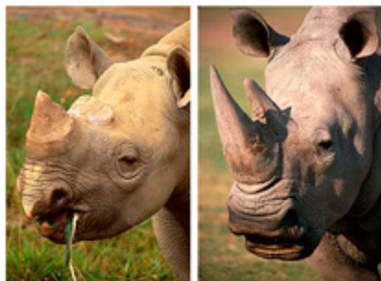
Pointed lip of black rhino. Square lip of white rhino. Белый и черный носорог

Пресс-служба Московского Клуба «Сафари» опубликовала на своем сайте www.safariclub.ru статистические данные о незаконной добыче носорогов в 2013 г. Данные, мягко говоря, неутешительные: количество носорогов, убитых браконьерами только в Южно-Африканской республике, возросло на 50%.