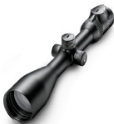
Swarovski Z6(i) 2.5-15x44 P (BT) / swarovskioptik.com

Австрийская компания представила на выставке SHOT Show-2014 в США свою новую разработку - индивидуальный баллистический регулятор (PBC), который повышает надежность стрельбы на дальние дистанции. Он подходит для всех оптических прицелов компании SWAROVSKI OPTIK с баллистическими турелями (Z6(i), Z5 и Z3). Каждая баллистическая турель теперь может быть также налажена с помощью регулятора, специально настроенного под ваши баллистические данные, на котором четко будут выгравированы ваши личные дистанции для стрельбы. Изготовленный по индивидуальному заказу регулятор (PBC) дает охотнику возможность считывать несколько дистанций вместо нынешних трех меток на баллистической турели. Охотник может легко считать значения дистанции стрельбы с турели, снабженной индивидуальной гравировкой, и в течение секунд выбрать правильные настройки, не теряя при этом цель. Можно в любой момент времени переключаться между индивидуальным баллистическим регулятором и стандартной системой, в которой используются кольца, без