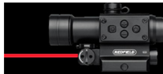
Redfield CounterStrike / redfield.com

Оптический прицел CounterStrike, выпускаемый компанией Redfield, удостоен престижной награды «Golden Bullseye», которую ежегодно присуждает Национальная ружейная ассоциация (США), досталась. Несмотря на то, что идет первый месяц 2014 г., прицел CounterStrike уже назван «Лучшей оптикой года».