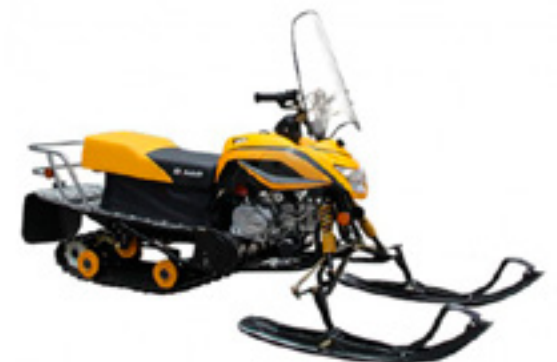
Динго T125

Вологодский магазин сообщил о новом поступлении миниснегочехов Irbis Dingo 125. В них применен ряд технических решений, которые используются на более дорогих моделях снегоходов. Новинка 2013 г. - улучшенная модель снегохода Irbis Dingo T110 - имеет разборную конструкцию и легко помещается в багажнике обычной «легковушки». Грузоподъемность снегохода - 150 кг или 2 человека. 5-тилитрового бака хватает (в зависимости от снежного покрова и нагрузки) на 100-150 км.