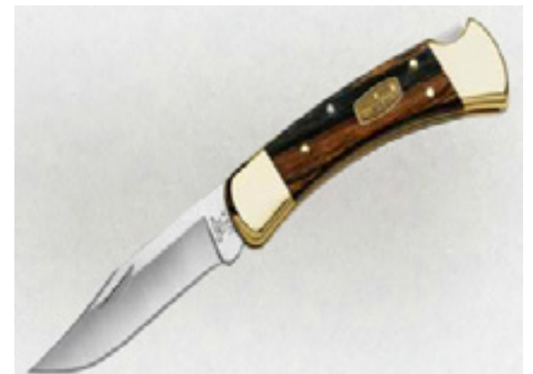
110 FOLDING HUNTER / buckknives.com

Ножевая компания Buck Knives была основана более в 1902 г. и за прошедшие годы стала одним из лидеров на рынке производителей складных ножей еже-