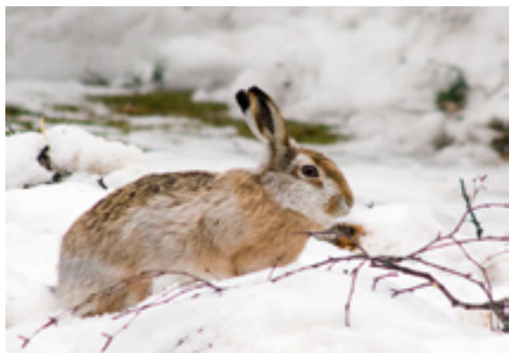
Заяц – русак

На сегодня в регионе насчитывается всего 200 зайцев-русаков. Охота на них сейчас запрещена.