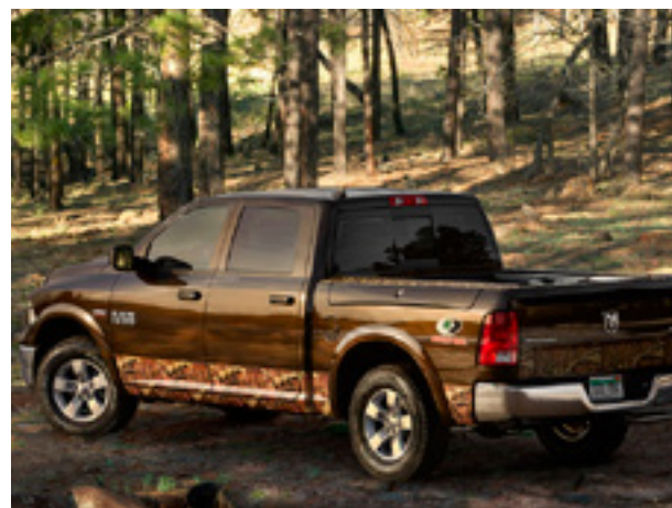
Ram 1500: Mossy Oak Edition

Ram 1500 Mossy Oak Edition адресован, в первую очередь, охотникам и любителям рыбной ловли. Внедорожник способен преодолевать серьезное бездорожье; при этом он очень вместителен и экономичен. Масса буксируемого прицепа может составлять до 1500 кг.