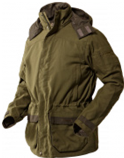
Pro Hunter X jacket / harkila.com

Сразу четыре новых продукта датской компании Seeland International, владеющей брендами Härkila и Seeland, имеют шанс в новом сезоне привлечь внимание охотников. В микрофлисовой куртке