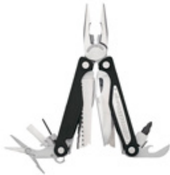
Leatherman Charge® AL / leatherman.com

Интернет-магазин plinker.ru сообщил о поступлении мультиинструментов