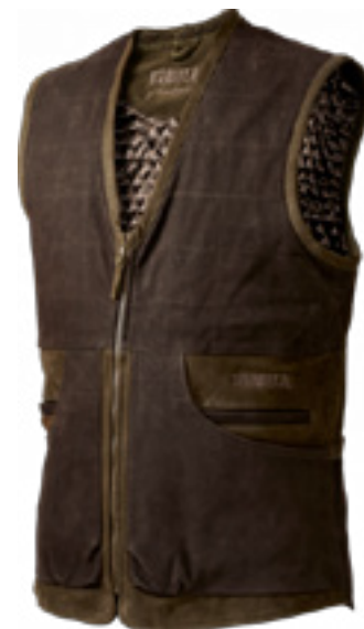
Angus waistcoat / harkila.com