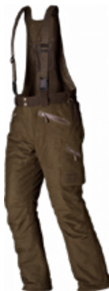
Visent trousers / harkila.com