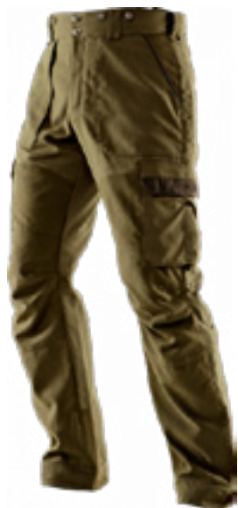
Pro Hunter X trousers / harkila.com