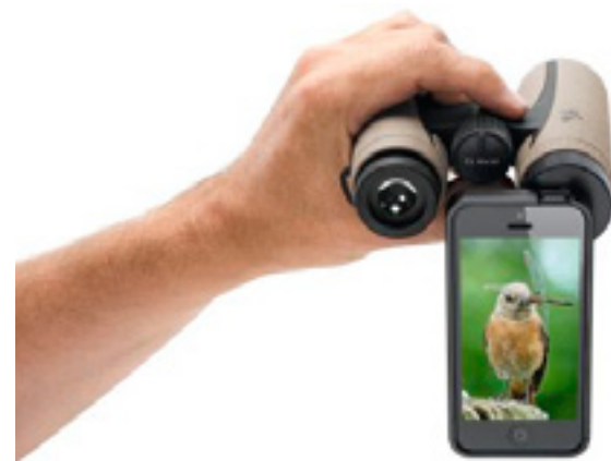
SWAROVSKI OPTIK PA-i5

У специализированных ритейлеров новый адаптер можно будет найти, начиная с марта 2014 г.