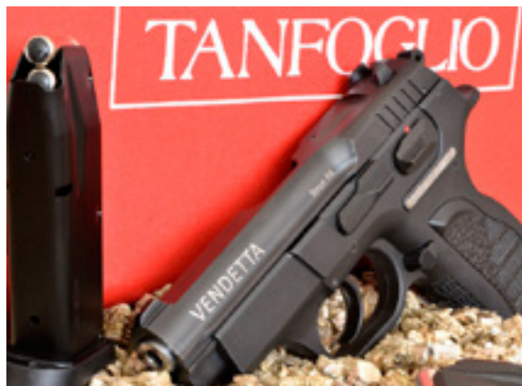
Vendetta Tanfoglio

Оружейный салон «Доминатор» первым в Москве сообщил о начале поступления в продажу пистолета Vendetta Tanfoglio, показанного осенью на выставке ARMS&Hunting в Гостином дворе. Небольшую партию таких пистолетов первым в столице получит именно салон «Доминатор». Оружие производится в России Климовским Специализированным Патронным Заводом (КСПЗ). При этом Vendetta обладает теми же качествами, что и итальянские пистолеты. У Vendetta такой же УСМ с блокировкой ударника, что позволяет ударнику достичь капсюля патрона лишь при полностью выжатом спусковом крючке. Рамка пистолета выполнена из ударопрочного полимера. Низкопрофильный затвор позволяет безопасно удерживать пистолет любым хватом кистью.